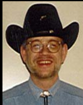
af Kim S. Andreasen

Jeg fortsætter nedenfor med 2. del af Ed Gilmore-interviewet fra 1961.