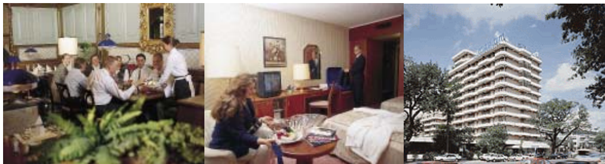
at Maritim Konferenzhotel Darmstadt