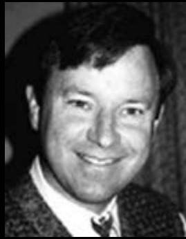
af David Cox